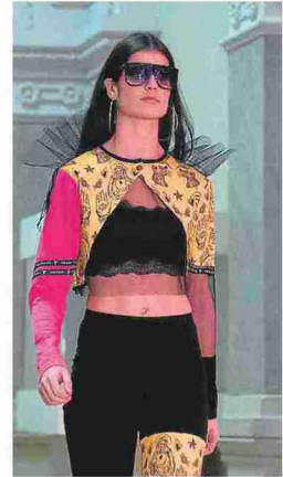
Diseño de VonLippe. F. JIMÉNEZ

Firmas aragonesas y diseño joven. La cita de ayer en el Museo de Zaragoza reunió al presente y el futuro de la moda en Aragón. Por un lado, los alumnos y exalumnos de Hacer Cretivo, por otro, firmas bajo el paraguas de Fitca.