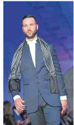
Diseño aragonés. A. NAVARRO